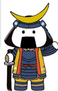
仙台・宮城観光PRキャラクター むすび丸

沿岸部に事業所を構える中小企業者のみなさま！ 労働者の新たな雇入れには本助成金をご活用ください！